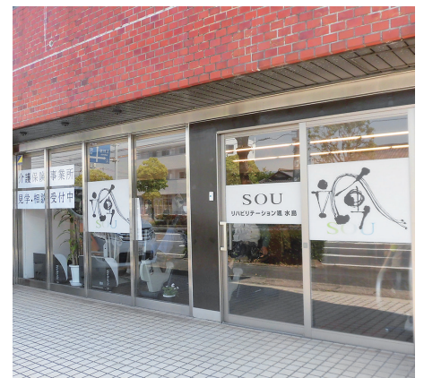
■医療法人 エム・ピー・エヌ 武田病院 HP http://takeda-h.byoinnavi.jp