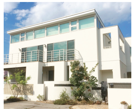
医療法人 エム・ピー・エヌ 武田病院 http://takeda-h.byoinnavi.jp