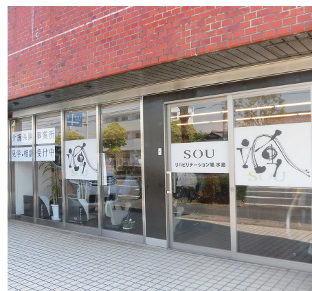
■医療法人 エム・ピー・エヌ 武田病院 HP http://takeda-h.byoinnavi.jp